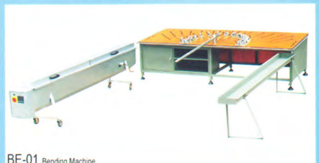
BE-01 Bending Machine

เครื่องตัดโค้ง จะทำให้เส้นไวนิล อ่อนตัวโดยการต้มในน้ำมัน ชนิดพิเศษ แล้วนำขึ้นมา เข้าขนาดของส่วนโค้งที่ต้องการ การตัดโค้งที่ดีจะต้องมี ตัว molding เฉพาะหน้าตัดของเส้นไวนิล แต่ละแบบ ซึ่งจะต้องใส่ molding ในทุกๆช่องของ ระบบ Multi-Chamber การตัดโค้งโดยวิธีนี้จะไม่ทำให้เกิดรอยย่นในเส้นไวนิล หรือการคืนตัว หลังจากการตัดโค้งแล้ว สามารถตัดได้ตั้งแต่ตัวกรอบ และตัวบาน ของประตู และหน้าต่าง รัศมีในการตัดโค้งเล็กสุดที่ 25 เซนติเมตร