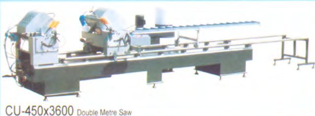
CU-450x3600 Double Metre Saw

สำหรับการเริ่มต้นผลิต ประตูและหน้าต่าง ไวนิล เครื่องตัดเป็นสิ่งจำเป็นที่จะต้องมี เพื่อใช้ในการตัดเส้นไวนิล ให้ได้ขนาดตามต้องการ เครื่องตัดของ NEUTE เป็นเครื่องตัดสองหัว ให้ความละเอียดถึงหน่วย มิลลิเมตร ทำให้ได้ขนาดของประตู และหน้าต่างถูกต้องแม่นยำ สามารถปรับมุมตัดได้ เช่น มุม 30, 45, 60, 90 องศา ทำให้เส้นไวนิลเข้ามุมได้สวยงาม