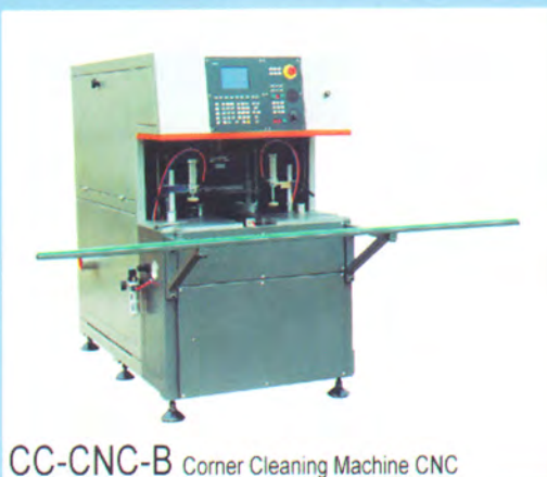
CC-CNC-B Corner Cleaning Machine CNC

หลังจากประตู และหน้าต่างไวนิล ได้ทำการเชื่อมเป็นเนื้อเดียวกันแล้ว ตรงมุมที่เชื่อมจะเกิดรอยเชื่อมที่ไม่ค่อยจะสวยงาม ดังนั้น NEUTE จึงได้มีเครื่องจักรเฉพาะใช้ในการทำความสะอาดมุม ของประตู และหน้าต่างไวนิล เพื่อให้มีความสวยงาม และแข็งแรง เครื่องจักรสามารถเก็บขอบบานเปิด บานเลื่อน และกรอบไวนิลทุกแบบ