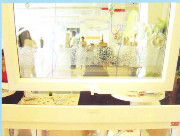
VILANN Cockspur Handle System for widely open of casement window to catch wind

ระบบมือจับบานเปิด และบานกระทุ้ง VILANN Cockspur เหมาะสำหรับหน้าต่างบานเปิดที่ต้องการเปิดรับลมกว้าง เป็นระบบ Single-point Lock มีจุด Lock เพียงจุดเดียว เปิดได้ทำมุมกว้างถึง 90 องศา ทำให้ง่ายต่อการเช็ดกระจก ด้านนอกบ้าน หรืออาคารสูงจากภายใน