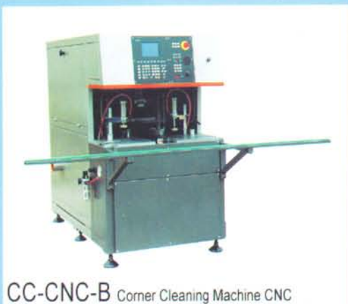
CC-CNC-B Corner Cleaning Machine CNC

หลังจากประตู และหน้าต่างไวนิล ได้ทำการเชื่อมเป็นเนื้อเดียวกันแล้ว ตรงมุมที่เชื่อมจะเกิดรอยเชื่อมที่ไม่ค่อยจะสวยงาม ดังนั้น NEUTE จึงได้มีเครื่องจักรเฉพาะใช้ในการทำความสะอาดมุม ของประตู และหน้าต่างไวนิล เพื่อให้มีความสวยงาม และแข็งแรง เครื่องจักรสามารถเก็บขอบบานเปิด บานเลื่อน และกรอบไวนิลทุกแบบ