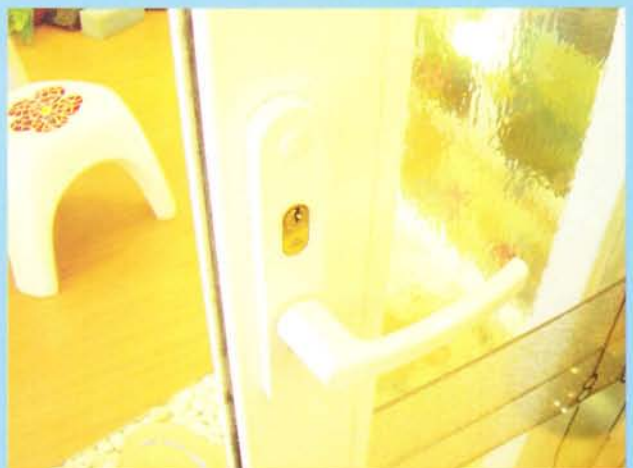
VILANN Handle and Lock System for Sliding Door combine beautiful and high security

ระบบมือจับแบบนี้สามารถติดตั้ง Multi-point Lock มีจุด Lock สูงถึง 4 จุด โดยการเปิด หรือปิดจากมือจับ ช่วยให้ บานปิดได้สนิท กันเสียงรบกวนจากภายนอก และให้ความ ปลอดภัยสูง สามารถใส่กุญแจ เพื่อใช้ในการไขเข้าออก เป็นประตูทางเข้าออกหลักได้