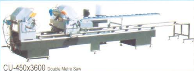
CU-450x3600 Double Metre Saw

สำหรับการเริ่มต้นผลิต ประตูและหน้าต่าง ไวนิล เครื่องตัดเป็นสิ่งจำเป็นที่จะต้องมี เพื่อใช้ในการตัดเส้นไวนิล ให้ได้ขนาดตามต้องการ เครื่องตัดของ NEUTE เป็นเครื่องตัดสองหัว ให้ความละเอียดถึงหน่วย มิลลิเมตร ทำให้ได้ขนาดของประตู และหน้าต่างถูกต้องแม่นยำ สามารถปรับมุมตัดได้ เช่น มุม 30, 45, 60, 90 องศา ทำให้เส้นไวนิลเข้ามุมได้สวยงาม