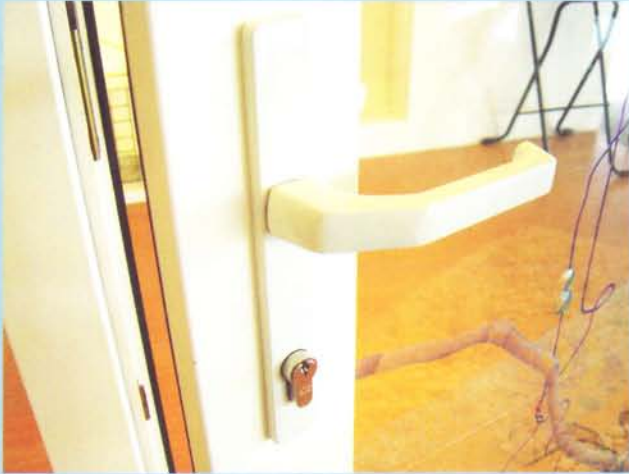
VILANN Handle System for Entrance Door Multi-point lock by close/open at handle

ระบบมือจับของ VILANN ที่ใช้กับประตูทางเข้า มีความสวยงาม เนื้อสีขาวมันเงา พร้อมทั้งมี ตัวกุญแจ สำหรับ Lock ประตู และมีแกนเหล็กตรงกลาง สำหรับการ ปิดที่ให้ความปลอดภัยสูงสุด สามารถใส่ระบบ Multi-point Lock ได้โดยมีจุด Lock สูงถึง 5 จุด สะดวกสามารถ Lock จากมือจับ ช่วยให้นานปิดสนิท และป้องกันการโจรกรรม