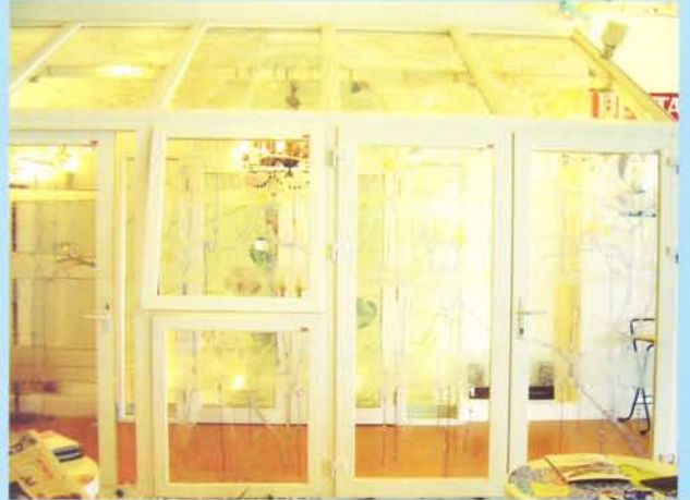
VILANN Handle and Lock Systems for vinyl windows and doors

VILANN เป็นระบบมือจับ และ Lock ที่ได้มาตรฐานยุโรป สามารถใช้ได้กับ ระบบประตู และหน้าต่าง ไวนิล ของ ประเทศเยอรมัน อังกฤษ ฝรั่งเศส ฯลฯ ระบบของวิวแลนน์ จะปิดได้แนบสนิท และประกอบเข้าได้อย่างสวยงาม พร้อมทั้ง ให้ความปลอดภัยสูงสุด