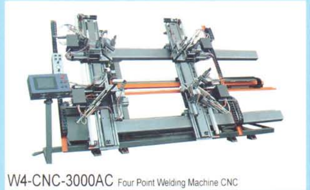
W4-CNC-3000AC Four Point Welding Machine CNC

เครื่องเชื่อมมุม เป็นหัวใจหลักของการผลิตประตูและหน้าต่าง ไวนิล เนื่องจากการเชื่อมมุมที่ดีในอุณหภูมิ 240 องศาเซลเซียส จะทำให้มุมทั้งสองของประตู และหน้าต่าง ไวนิล ละลายเชื่อมตัวกันเป็นเนื้อเดียว และมีความแข็งแรงมากที่สุด เครื่องเชื่อมมุมแบบ 4 จุด จะทำการเชื่อมมุมทั้ง 4 จุด ของประตู และหน้าต่าง พร้อมกัน โดยใช้คอมพิวเตอร์ในการควบคุม