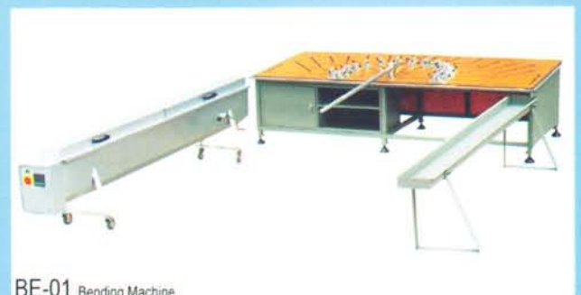
BE-01 Bending Machine

เครื่องตัดโค้ง จะทำให้เส้นไวนิล อ่อนตัวโดยการต้มในน้ำมัน ชนิดพิเศษ แล้วนำขึ้นมา เข้าขนาดของส่วนโค้งที่ต้องการ การตัดโค้งที่ดีจะต้องมี ตัว molding เฉพาะหน้าตัดของเส้นไวนิล แต่ละแบบ ซึ่งจะต้องใส่ molding ในทุกๆช่องของ ระบบ Multi-Chamber การตัดโค้งโดยวิธีนี้จะไม่ทำให้เกิดรอยย่นในเส้นไวนิล หรือการคืนตัว หลังจากการตัดโค้งแล้ว สามารถตัดได้ตั้งแต่ตัวกรอบและตัวบาน ของประตู และหน้าต่าง รัศมีในการตัดโค้งเล็กสุดที่ 25 เซนติเมตร