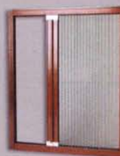
หน้าต่างอลูมิเนียม