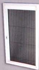
หน้าต่างอลูมิเนียม