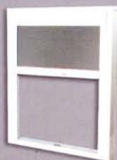
หน้าต่างอลูมิเนียม

HEVTA Insect Screen : บริการติดตั้ง-บนหน้าต่างทั้งแบบกรอบ UPVC, ไม้อลูมิเนียม, ไม้พลาสติก